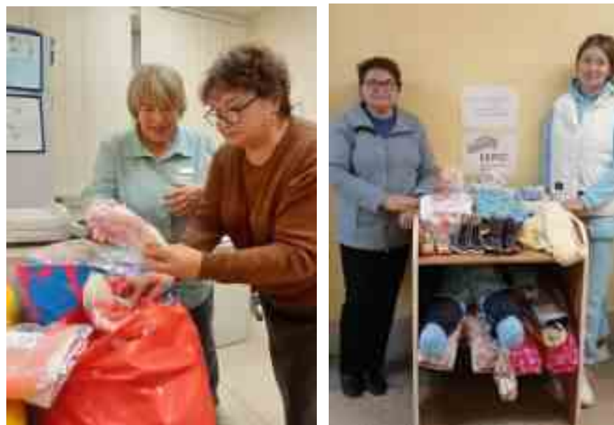
Пункт выдачи одежды в ЖК №1

С сентября в Женской консультации Дзержинского района появился пункт выдачи одежды для малышей . На специальном столике будущие мамы, приходя на прием, могут взять любые понравившиеся ей вещи для своих малышей. Запасы одежды пополняет доброволец из епархиального гуманитарного центра.