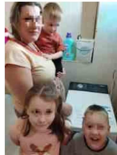
Яна с детьми на фоне новой стиральной машины

У Яны трое деток и на момент оказания помощи должен был появиться четвертый. Как раз незадолго до этого у нее сломалась стиральная машина - серьезная неприятность для многодетной мамы. С маленькими детьми стирки всегда хватает, а стирать вручную на последнем месяце беременности крайне сложно. Поэтому новая стиральная машина оказалась как нельзя кстати.