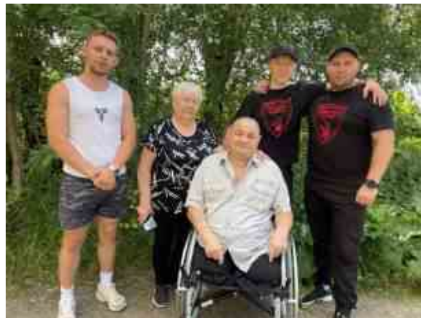
Прогулка с дядей Витей

К сожалению, исполнить мечту Виктора Миновича о рыбалке не успели. Осенью дядя Витя отошел ко Господу.