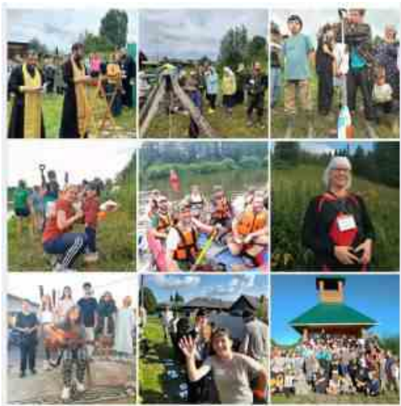
Моменты слета «Сретение-2025»

Традиционно в конце июля наш фонд проводит Слет трезвости и здоровья «Сретение». Его основная идея - пропаганда здорового и, главное, трезвого образа жизни, утверждение традиционных семейных ценностей.