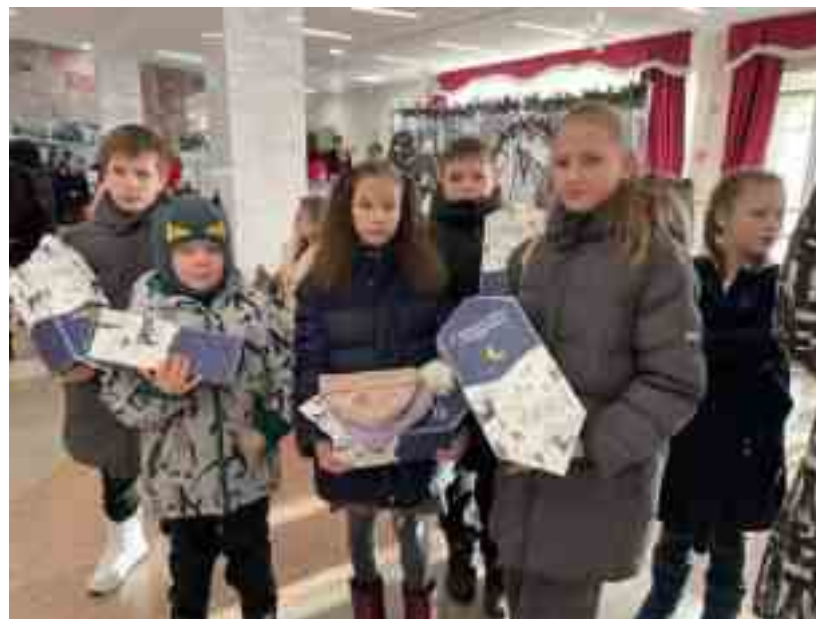
Дети-участники Архиерейской елки с подарками

«Подари радость на Рождество». Дети из подопечных семей заранее изготовили открытки для благотворителей на «Елку желаний». На Елке, установленной в храме Сергия Радонежского, были развешаны шарики с мечтами и заветными желаниями детей, к каждому шариком прикреплялась открытка от ребенка. Благотворитель мог снять с елки понравившуюся открытку с шариком, купить указанный подарок и принести его с шариком в наш фонд. Открытка остается на память благотворителю. По итогу акции 73 ребенка из подопечных семей получили подарки с «Елки желаний» и еще 88 детей были приглашены в Городской Дворец творчества на Архиерейскую елку с театральным представлением и сладкими подарками.