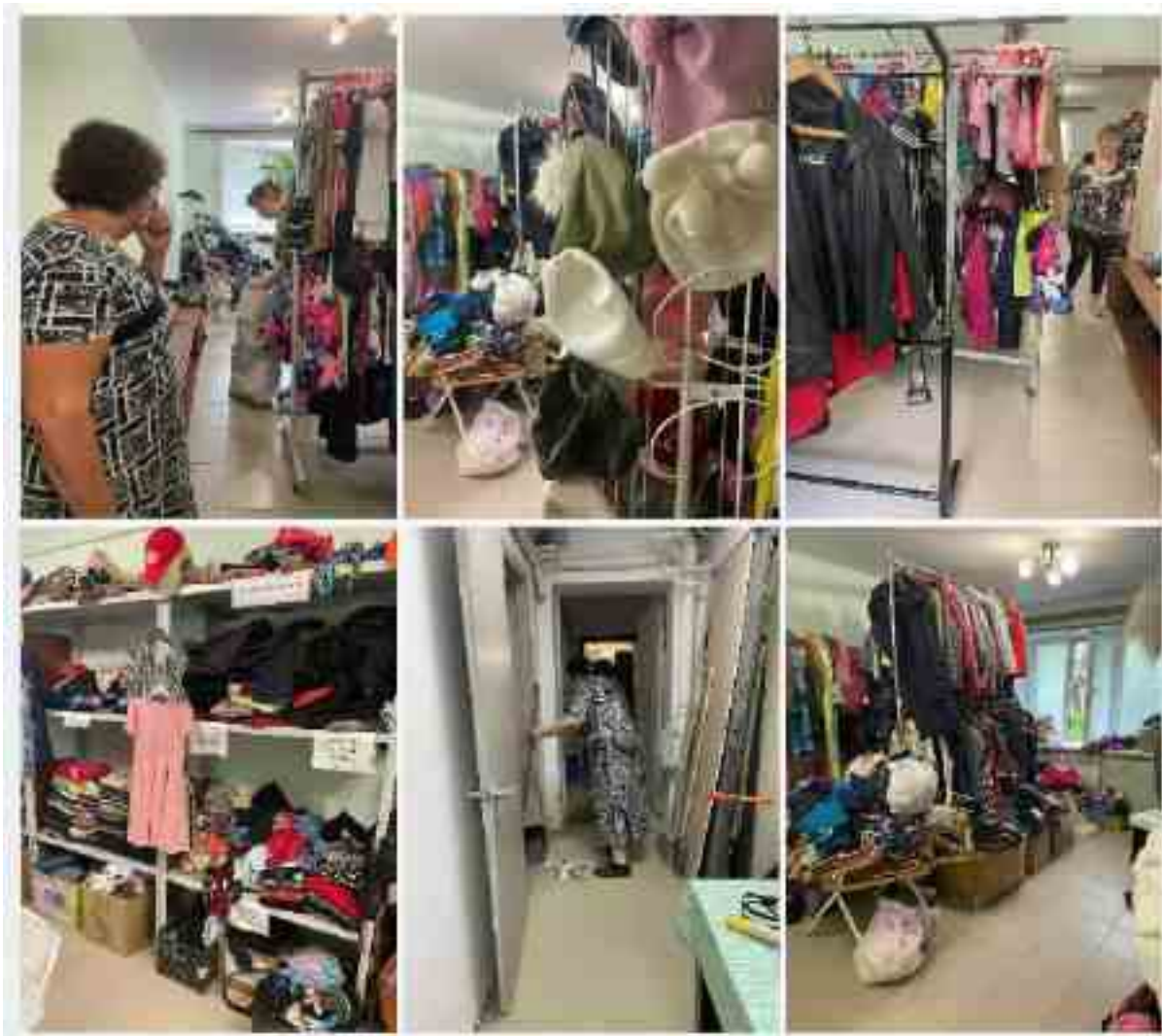
Генеральная уборка на вещевом складе

Периодически на вещевом складе гуманитарного центра требуется генеральная уборка. Обычно к ней привлекаются добровольцы. В 2025 году впервые в качестве эксперимента мы решили предложить подопечным семьям поучаствовать.