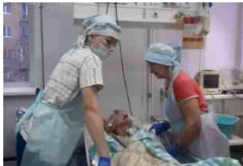
Сестры милосердия на служении в Неврологическом отделении Демидовской ГБ

Неоценимая помощь медперсоналу в уходе за тяжело больными лежачими пациентами оказывается нашими сестрами каждый понедельник в ДГБ. Особенно это ощутимо в дни карантинов, когда родственников не пускают, а на медицинских сестрах больше забот, чем прежде. Благодарность помощницам поступает не только от персонала, но и от самих больных.